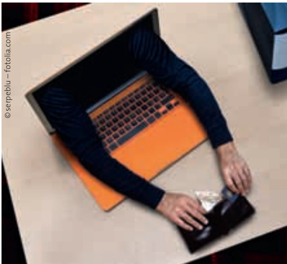
Neue Straftatbestände: Datendiebstahl und -fälschung

Wenn die Strafverfolgungsorgane nicht in der Lage sind, Straftaten zu verfolgen oder Gefahrenabwehr zu betreiben, beeinträchtigt das die Rechtsposition der Bürger. Die freiheitlich-demokratische Grundordnung der Bundesrepublik, ein Europa offener Grenzen sowie