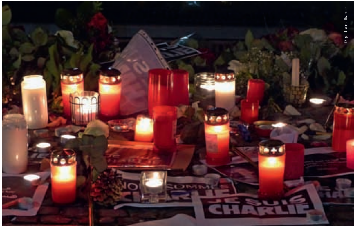
Zunehmende Herausforderung: Bedrohung durch Terroristen

Die Schwäche der aktuellen Gesetzgebung, das Dilemma der Strafverfolger zeigen bereits die o. a. Zahlen des Bundesamtes für Justiz. In den 12 572 Ermittlungsverfahren wurden Anfragen zu 20 242 Anschlüssen gestellt, in 3 330 Fällen blieb die Maßnahme ergebnislos, weil die abgefragten Daten ganz oder teilweise nicht (mehr) verfügbar waren. Der Grund hierfür ist, dass die Verkehrsdaten nicht für die Strafverfolger gespeichert