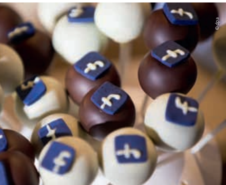
Bedenkenlose Preisgabe persönlicher Daten über Social Media wie Facebook ...